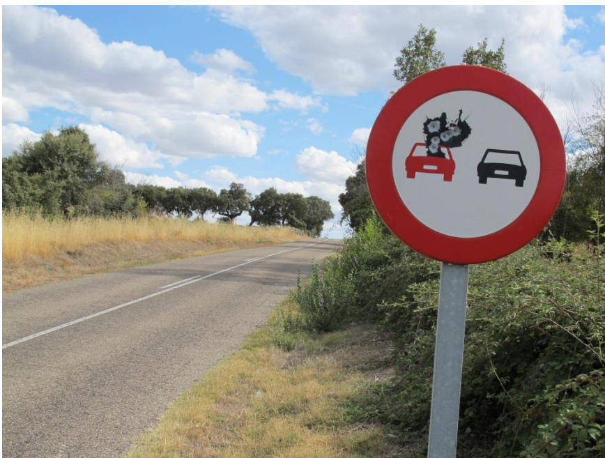
Imagen 1. Vista general panorámica del tramo de carretera afectado.