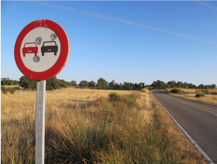
Imagen 1. Vista general panorámica del tramo de carretera afectado.