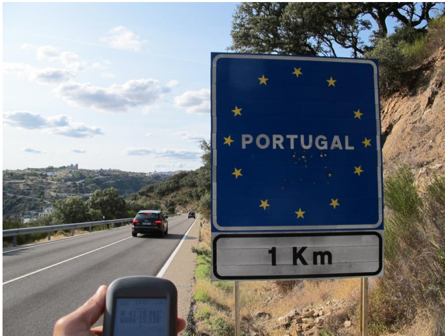
Imagen 1. Vista general panorámica del tramo de carretera afectado. Cartel de proximidad del país vecino de Portugal tiroteado con arma corta de 9 mm.