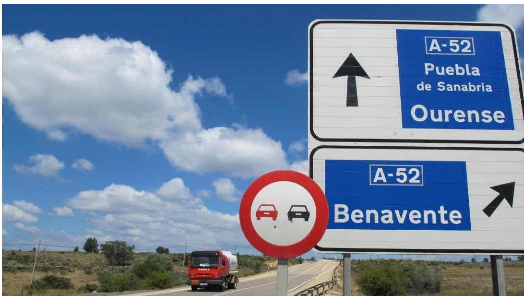
Imagen 1. Vista general panorámica del tramo de carretera afectado.