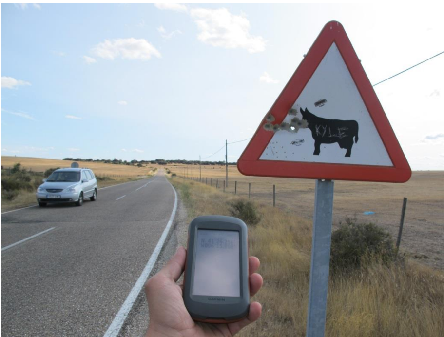
Imagen 1. Vista general panorámica del tramo de carretera afectado.