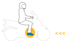
Conductores de ciclomotores