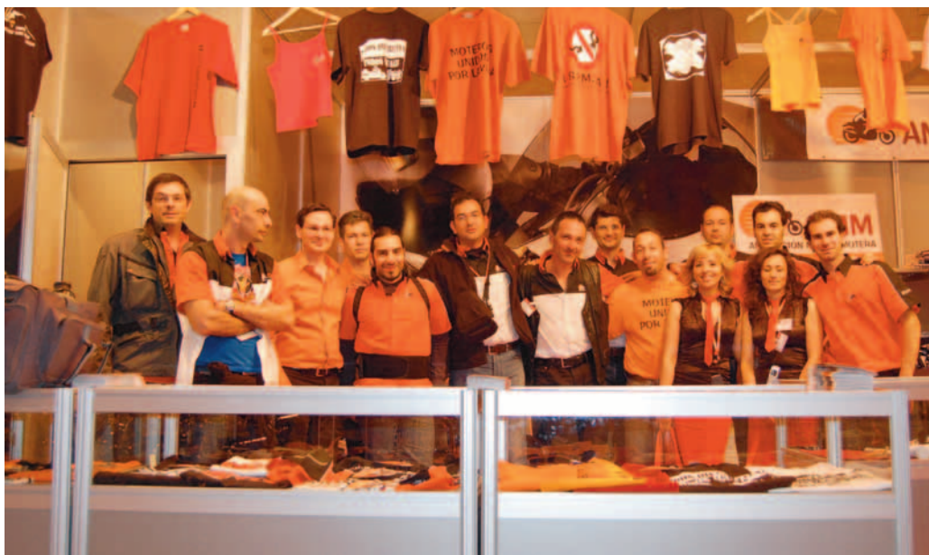
Equipo de socios voluntarios en el salón