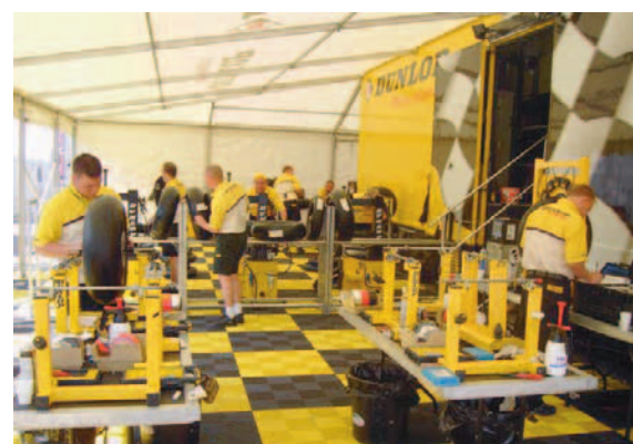
Boxes de Dunlop