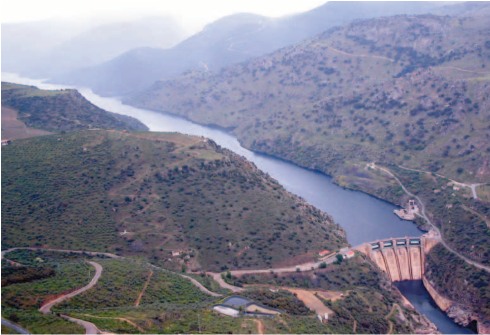
Presa de Saucelle, sobre el río Duero

Si el Che y su amigo recorrieron Sudamérica en una Norton 500, ¿Por qué no habríamos de llegar nosotros al Atlántico con una Virago 535? Disfrutamos de cada kilómetro del camino y debe ser eso lo que diferencia a los moteros