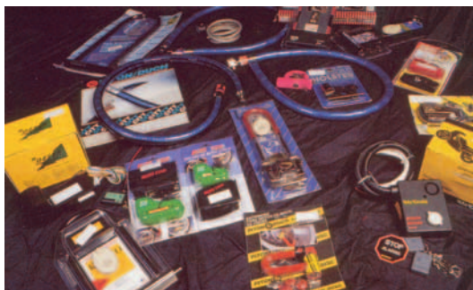
Variedad de candados

Aquí seguimos dejándonos asesorar por el dueño de la tienda-taller, que ni es