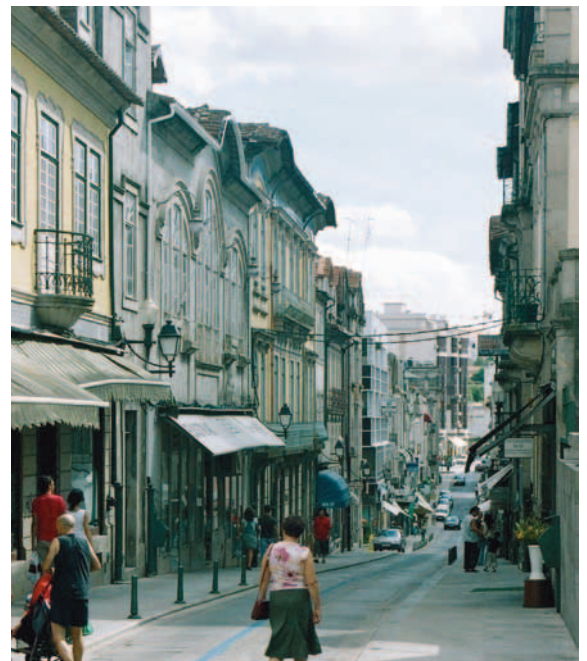
Calle de Oporto

Siguiendo por la nacional se continúan bajando y subiendo valles a velocidades medias tranquilas. Los viñedos dejan entrever las Quintas y las bodegas en las laderas que van a morir al río. Estamos en zona de vino de Oporto y viendo las dificultades del camino, demasiadas curvas para un neomotero, se envidian las barcas que en otro tiempo transportaron la miel, el aceite o el vino hasta la ciudad.