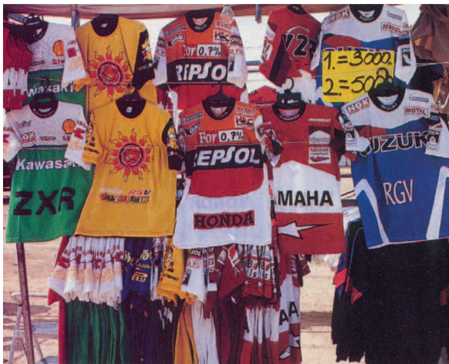
Típica tienda en las carreras

Colegas, no sé cómo voy a salir de ésta. Tengo que ser fuerte y afrontarlo, asesorarme, buscar ayuda, medicarme si conviene (sólo si conviene), acudir a un especialista, presentarme a terapias de grupo. Algo hay que hacer al respecto, porque así no se puede vivir. Sí, lo reconozco; cada día estoy más enganchado al “shopping”. Me gusta ir de compras. Disfruto porque el abanico de precios es enorme; desde lo más tirado (rozando lo ilegal) a lo más pijotero, desde lo más popular a lo más singular.