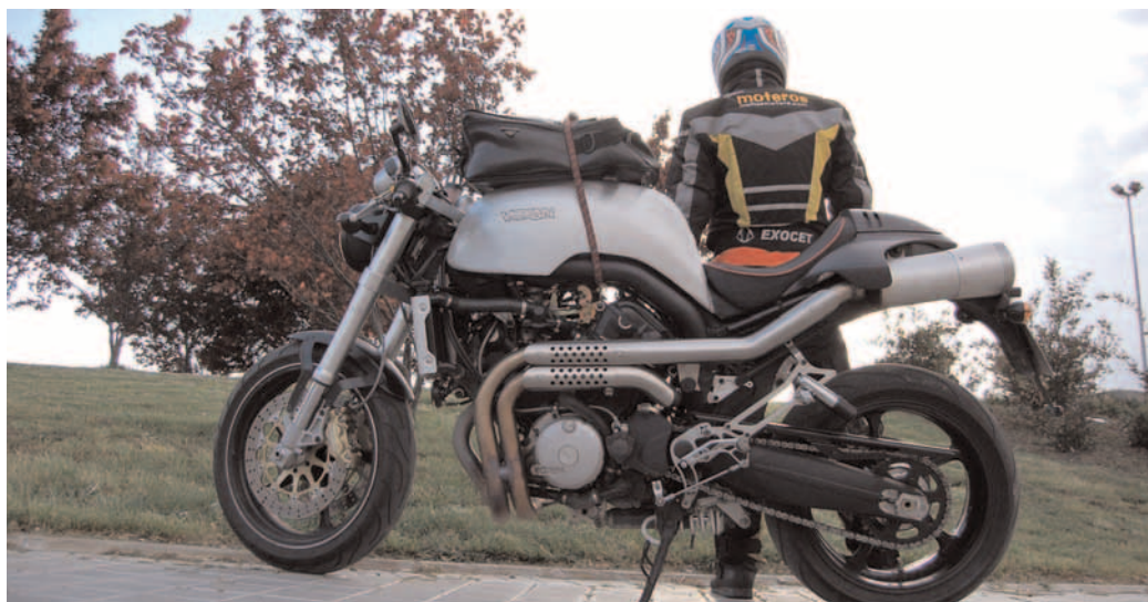
Estampa Café Racer