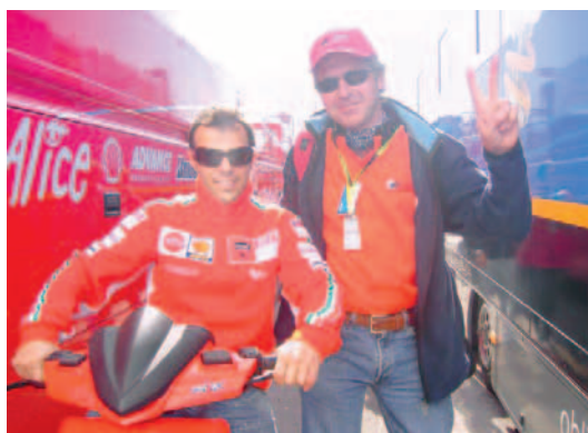
Con Loris Capirossi

La comida, en el Hospitality, nos sentó a la mesa con MVA y MAPFRE. A los primeros los conocíamos, pero a los de MAPFRE no, y como es posible que en un futuro tengamos que tratar con ellos de cerca, les puse al día de la realidad de la AMM, de sus proyectos y de los logros conseguidos desde su constitución. La prisa lo hizo marchar y nos quedamos sin padrino que nos introdujera en el box de Bautista. Con cafelito, aire acondicionado y los entrenamientos en las pantallas de plasma del comedor, esperamos