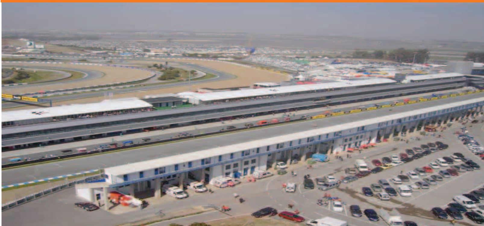
Vista aérea de los boxes y parking