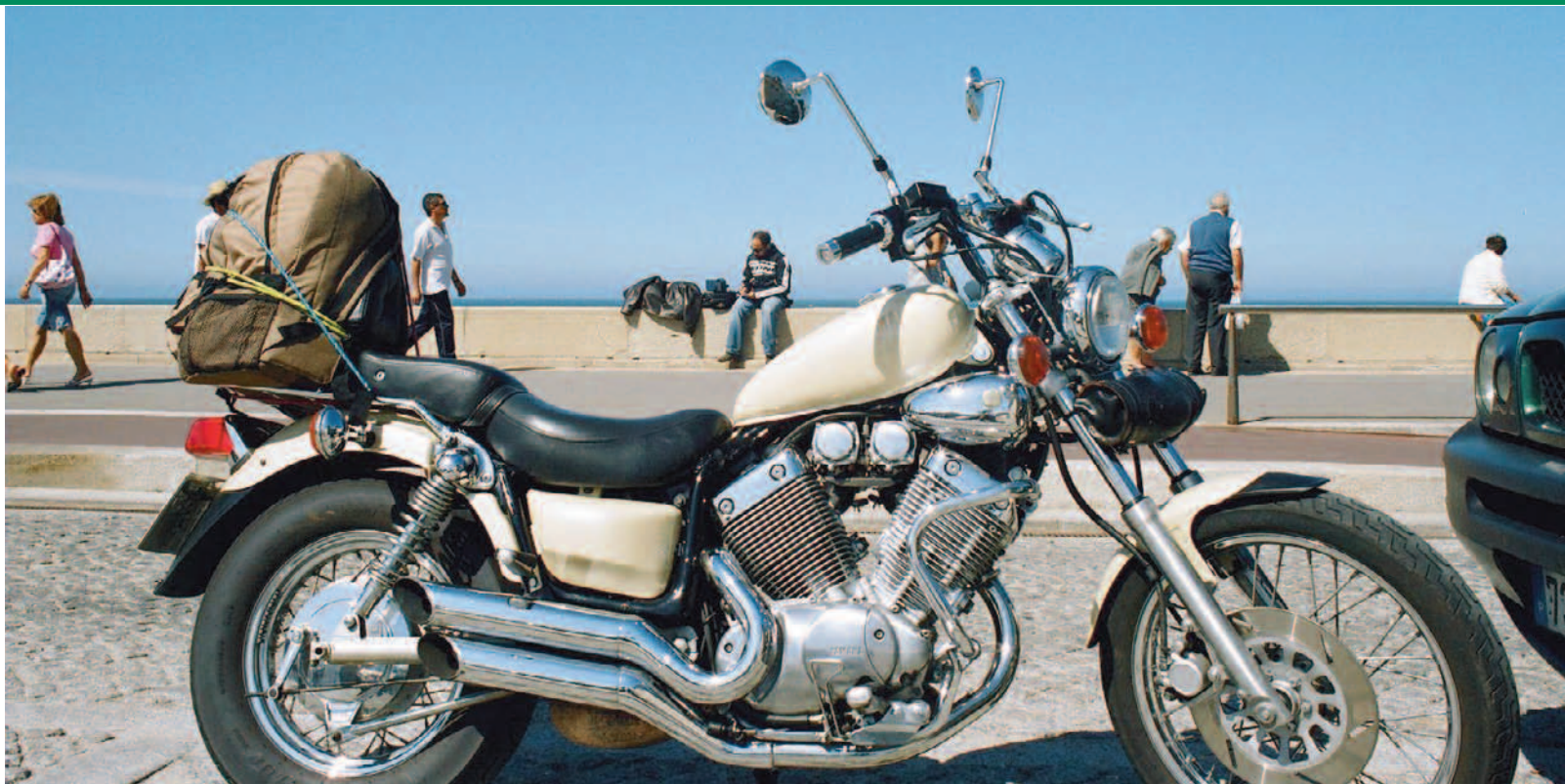
Con la Virago 535 en el malecón de Espinho

Decidimos que costase lo que costase iríamos acompañando al río en su discurso hacia el mar sin importar siquiera que hubiera otras opciones más fáciles para llegar a Oporto