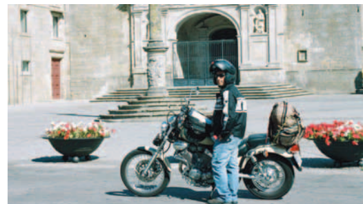
Plaza de Viseu

Los últimos 130 Km. desde Peso da Régua son casi 3h y media de conducción.