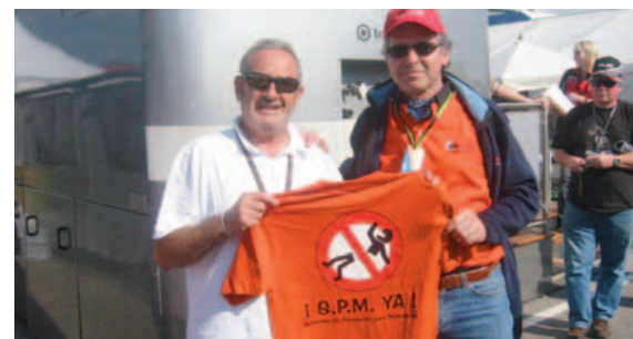
Con Carlos Arguiñano

Y es que cuando topas con gente así todo se ve de otro color y piensas que sí, que todos nuestros esfuerzos merecen la pena y que ojalá muy pronto podamos contar tantos kilómetros de carreteras con guardarraíles protegidos como personas asistentes a este Gran Premio de Jerez. Como mínimo.