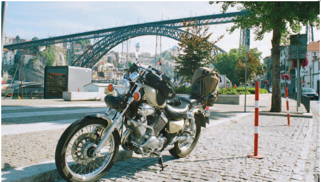
Puente de Luis I diseñado por un discípulo de Eiffel