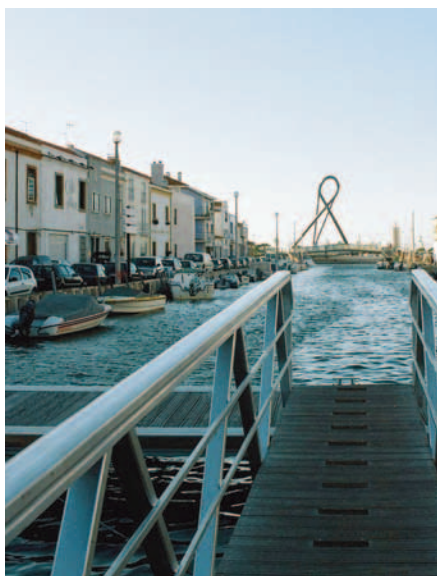
Canal de Aveiro

Decidimos parar en Peso de Régua ciudad grande denominada, no sé si sólo por sus "incondicionales" habitantes, como la Capital do Douro. Lo más destacable fue nuestro primer encuentro con un motero. Intercambiamos información y mientras Humberto mantenía una charla distendida con él mi cabeza huía hacia comparaciones banales: Intruder 1400 vs. Virago 535...Humberto vs. Chica guapa...que pena que mi novia y las motos vayan por autopistas di-