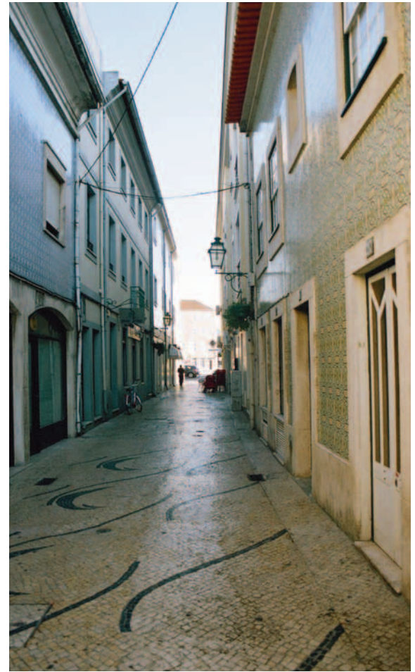
Calle típica de Aveiro

No olvidar: Visitar la industria artesanal de cestería, de botellas roturadas en estaño, de barcos Rabelos y de elaboración de toneles.