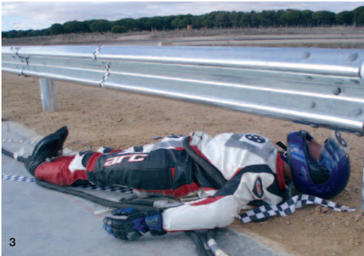
1. Imagen Pre Test 2. Imagen Pre Test 3. Imagen Pre Test