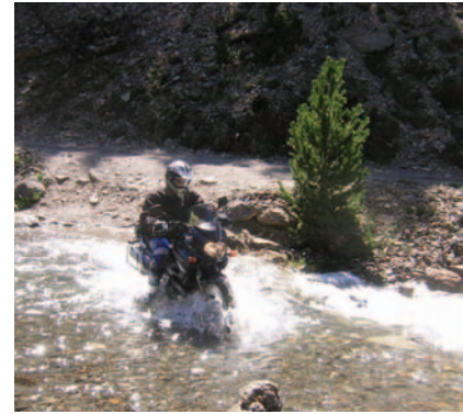
Vadeo en tierras andorranas

Si bien hoy en día Andorra tiene Constitución escrita e instituciones homologables con las de los países de su entorno, muchas tradiciones feudales han llegado