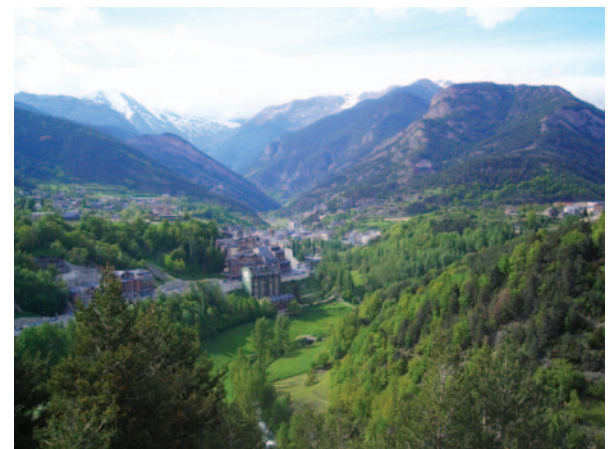
Panorámica desde Sant Cristòfor