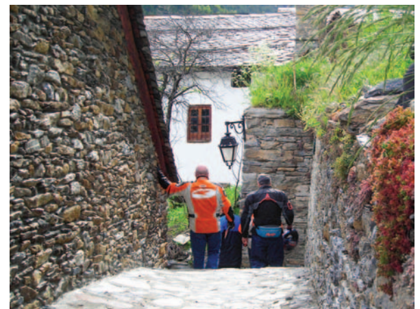
El casco antiguo de Pal, Patrimonio de la Humanidad