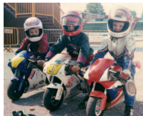
Viaje a Córcega, pag 32