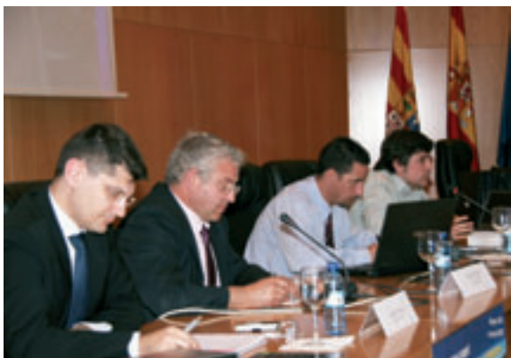
Ponentes en las Jornadas

Por cuarto año consecutivo y dentro de las actividades programadas para la Seguridad Vial por el Grupo de Accidentes de Tráfico y S. Vial del I3A de la Universidad de Zaragoza, se han realizado durante los días 15, 16, 17 y 18 de mayo las "IV Jornadas sobre Búsqueda de Soluciones al Problema de los Accidentes de Tráfico".