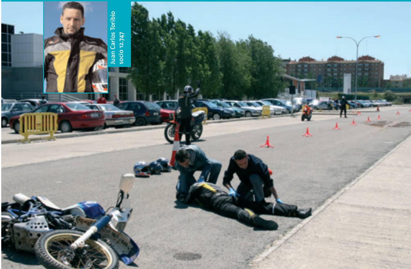
Simulacro de accidente.