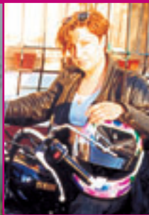
Aijú socia 7334