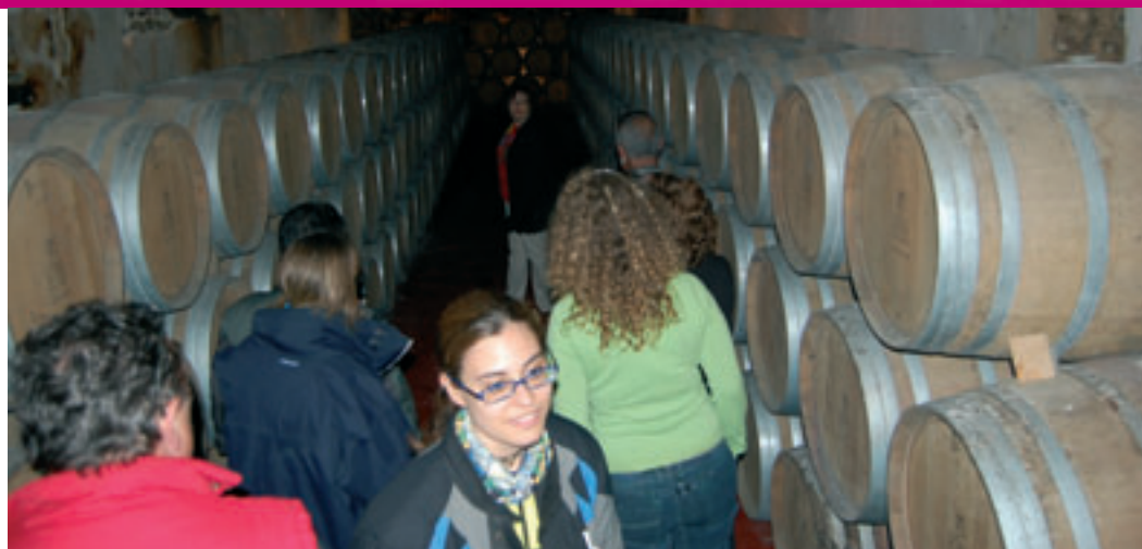
Visita a las bodegas Bordejé en Ainzón, Zaragoza.

Los trofeos se entregaron en la misma Bodega, y después llegó el odiado adiós. Siempre las despedidas son difíciles, pero en "Rosas" más, pues la gente se queda con ganas de más tiempo para estar con los amigos, ya que a muchos no los ves si no es allí, al venir de todos los rincones de la península.