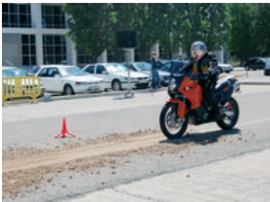
Pruebas de frenado.

diferentes políticas comunitarias de seguridad vial, demandas y logros para los motoristas.