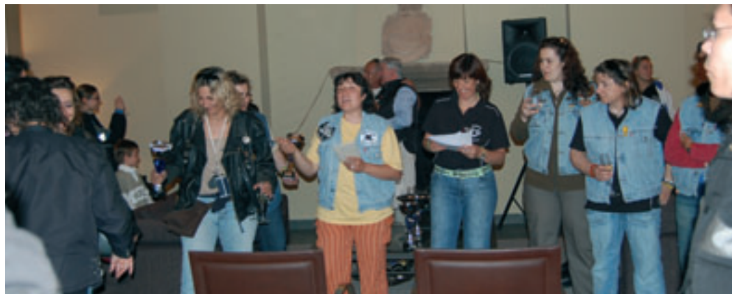
Durante el sorteo de regalos.