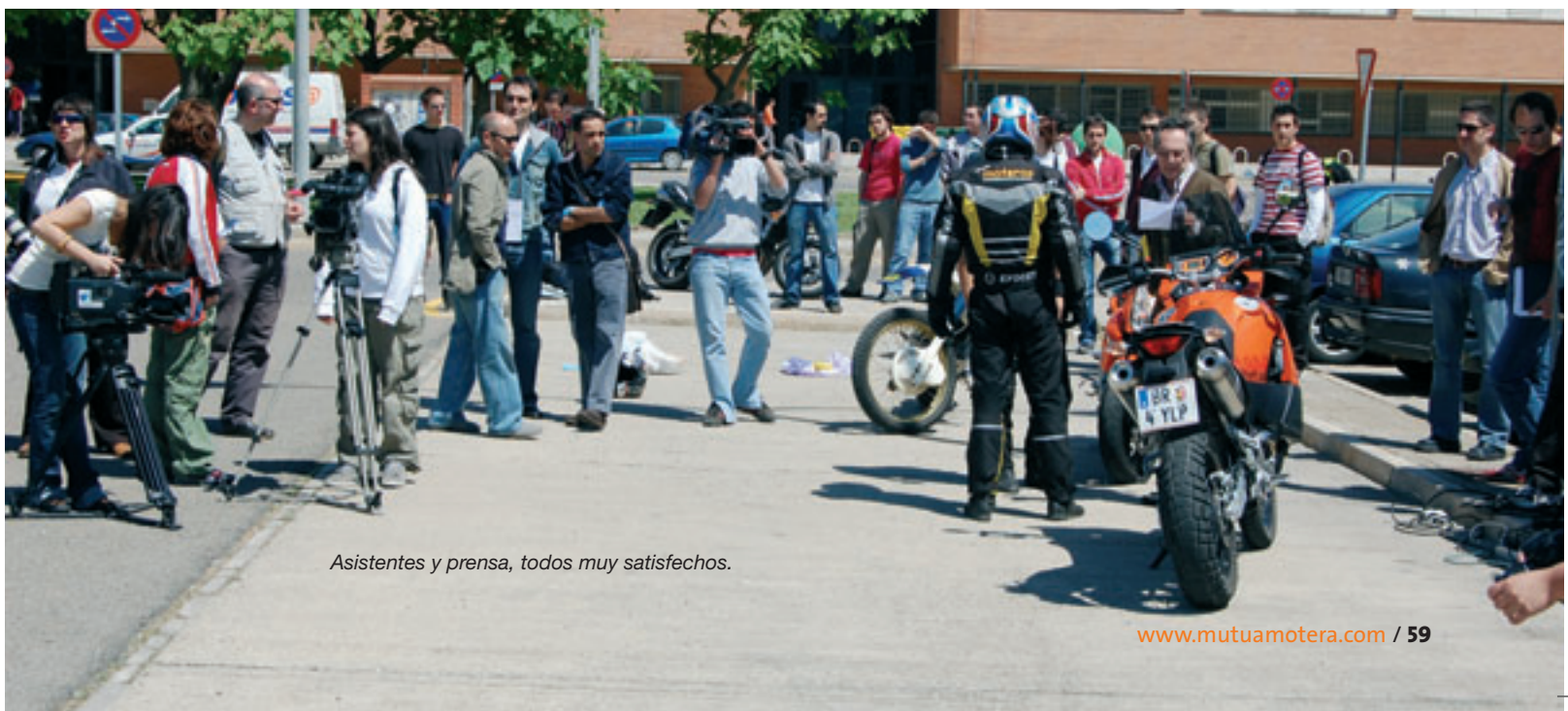
Asistentes y prensa, todos muy satisfechos.