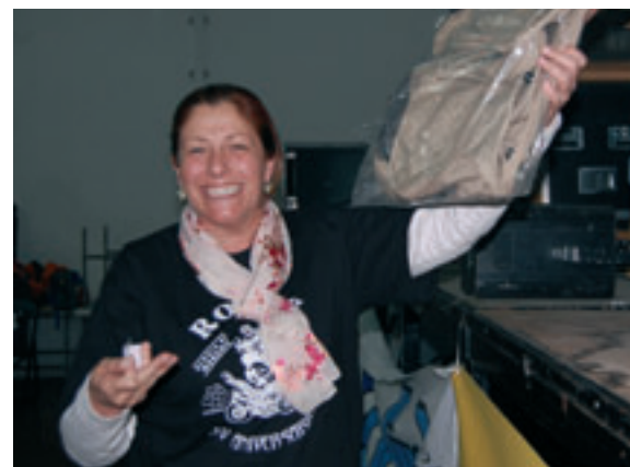
Afortunada en el sorteo.

Y así podría contaros un montón de buenas historias que, de año en año, se viven en "Rosas". No sé si vais pillando lo que es todo esto: aparte de una Concentración de Mujeres en moto, es la evolución de la mujer en su vida personal en el mundo de la moto, sin disminuir un ápice la afición por las dos ruedas. ¿Os animas al año que viene a compartirlo?